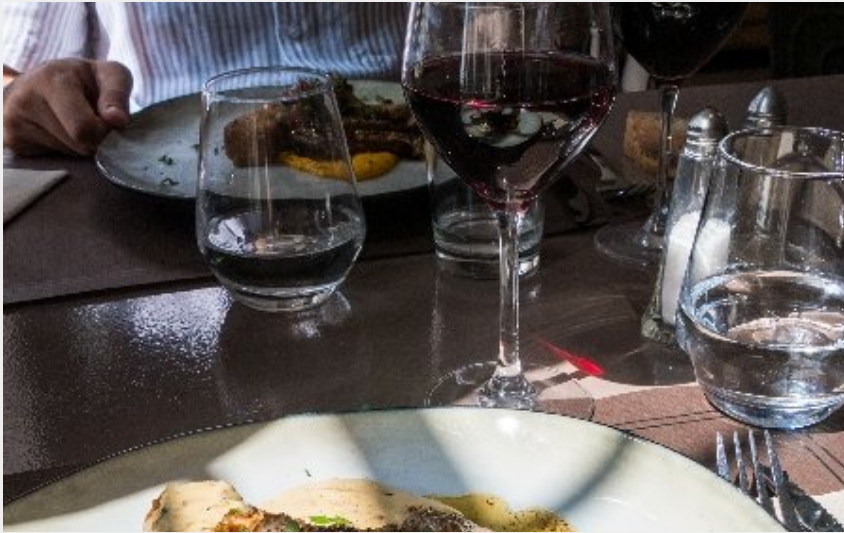
Crédit photo : La Petite Halle (OFFICE TOURISME DU PAYS DE LA MUSE ET RASPES DU TARN)