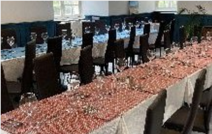
Crédit photo : Brasserie du Domaine de l'Ecrin Vert (OFFICE DE TOURISME DU REQUISTANAIS)