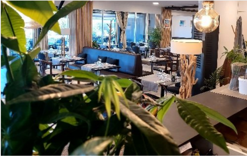
Les Reflets du Lac