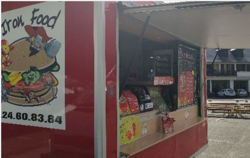
Crédit photo : L'Iron Food (OFFICE DE TOURISME DE PARELOUP LEVEZOU)