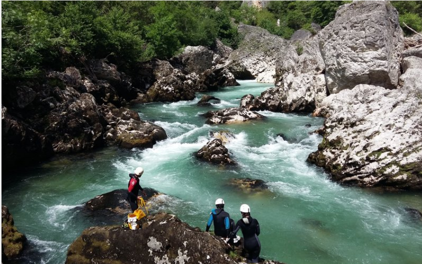
Crédit photo : Rando aquatique - nage en eaux vive (B&ABA SPORT NATURE)