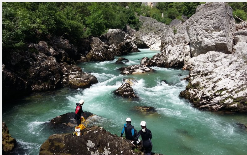
Rando aquatique - nage en eaux vive