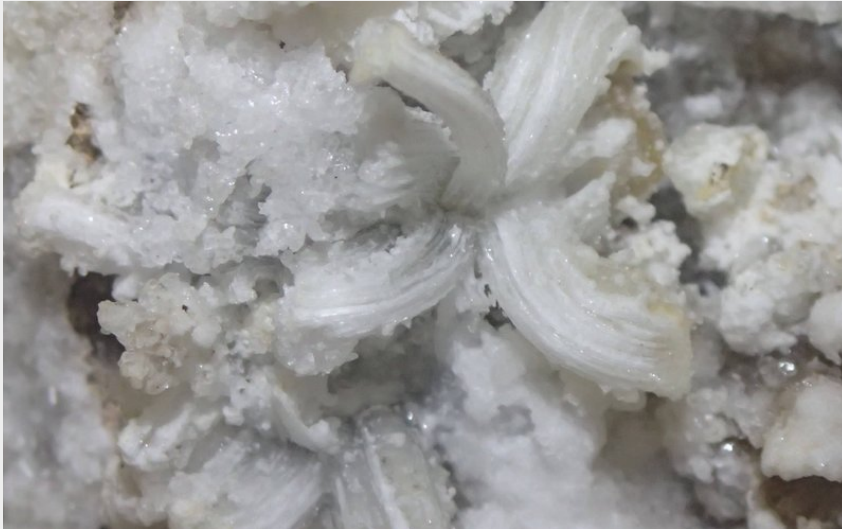
Crédit photo : B&ABA SPORT NATURE spéléo - fleur de gypse (B&ABA SPORT NATURE)