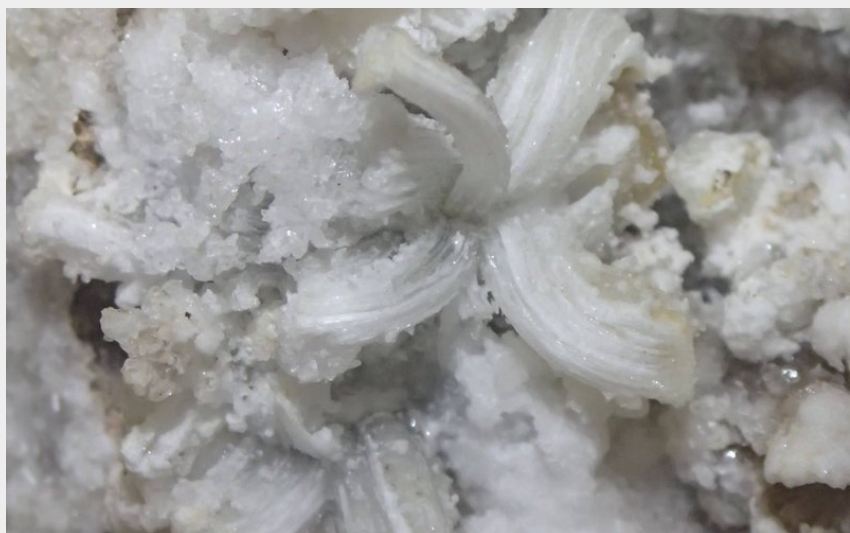
Crédit photo : B&ABA SPORT NATURE spéléo - fleur de gypse (B&ABA SPORT NATURE)