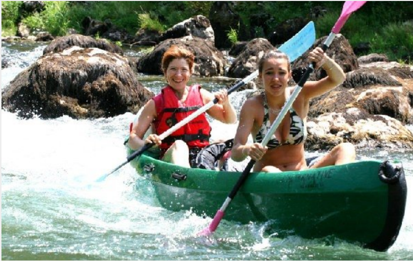
Crédit photo : Descente dans les Gorges du Tarn (L'ALTERNATIVE canoë kayak)