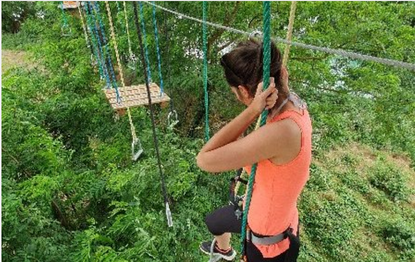
Crédit photo : Antipodes Arbres et Cimes - Parcours dans les arbres (Antipodes)