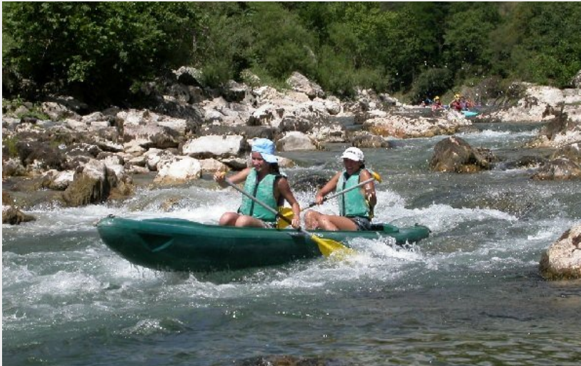
Crédit photo : Descente des Gorges du Tarn en canoë-kayak (Esprit Nature Canoë)