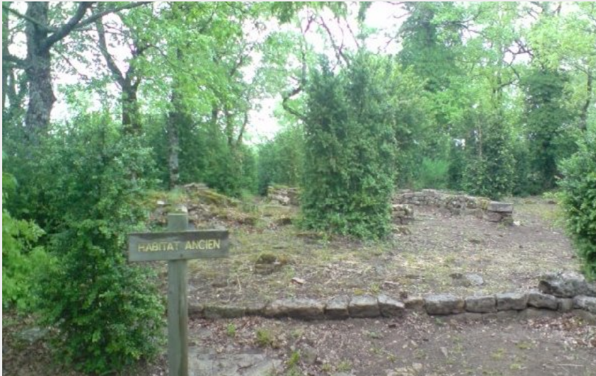
Crédit photo : Espace du Sabel : le Mas Viel (SYNDICAT D'INITIATIVE DES RASPES DU TARN)