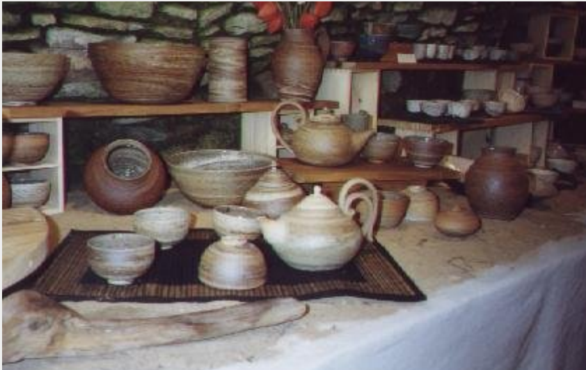
Crédit photo : Marie-Christine Darley - Céramiste (OFFICE DE TOURISME LARZAC VALLEES)