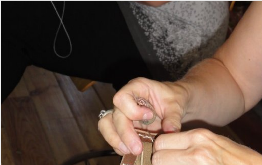
Crédit photo : Atelier Romy : travail du cuir, stages et formations. (Atelier Romy)