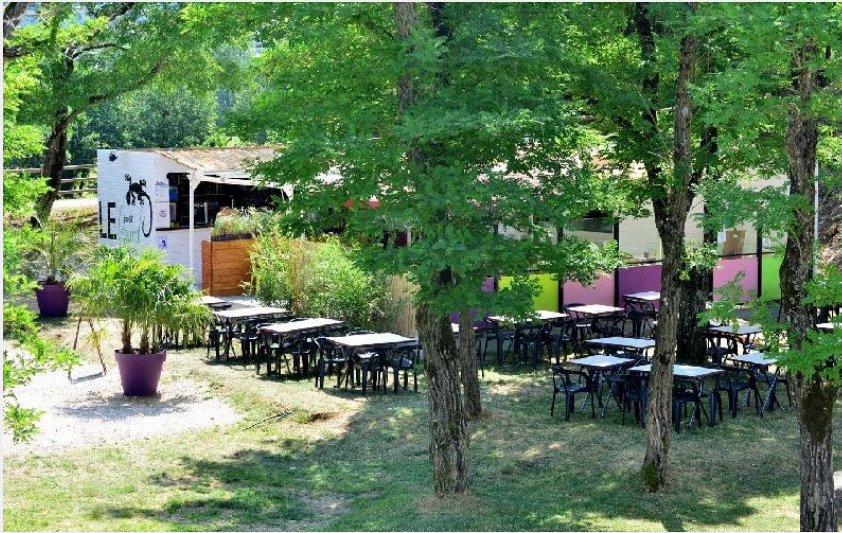
Crédit photo : Lac de la Cisba (OFFICE DE TOURISME DE SEVERAC LE CHATEAU)