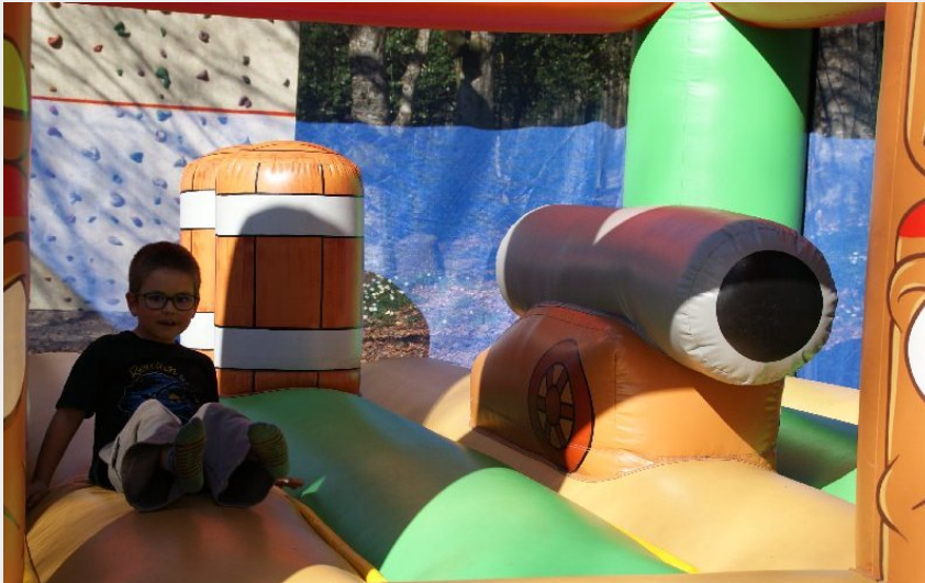
Crédit photo : Grimpe et Cimes - Jeu Gonflable - Trampoline (Grimpe et cimes)