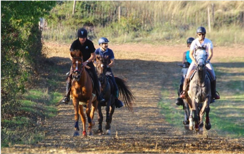
Crédit photo : Piste de galop de la Cazotte (Lycée Agricole de la Cazotte)