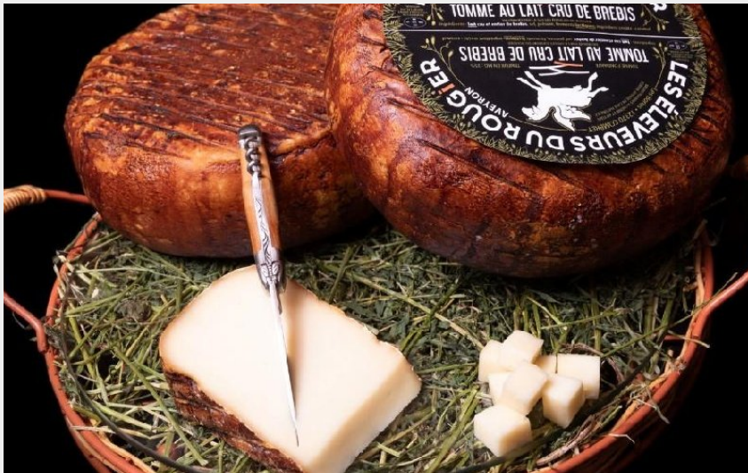
Visite à la ferme Chez Alice et Sylvain