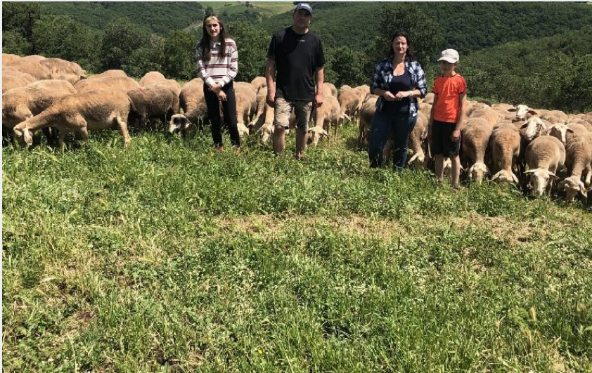
Visite à la ferme Chez Séverine et Daniel