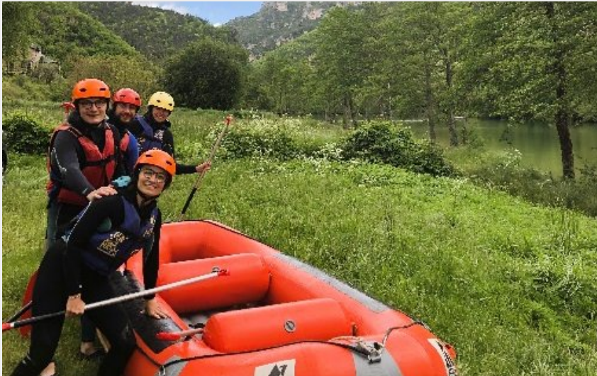
Crédit photo : B&ABA Sports Nature - Mini Raft (B&ABA Sport Nature)