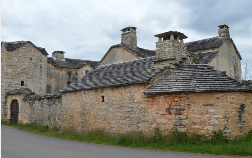
Ferme aux Monziols