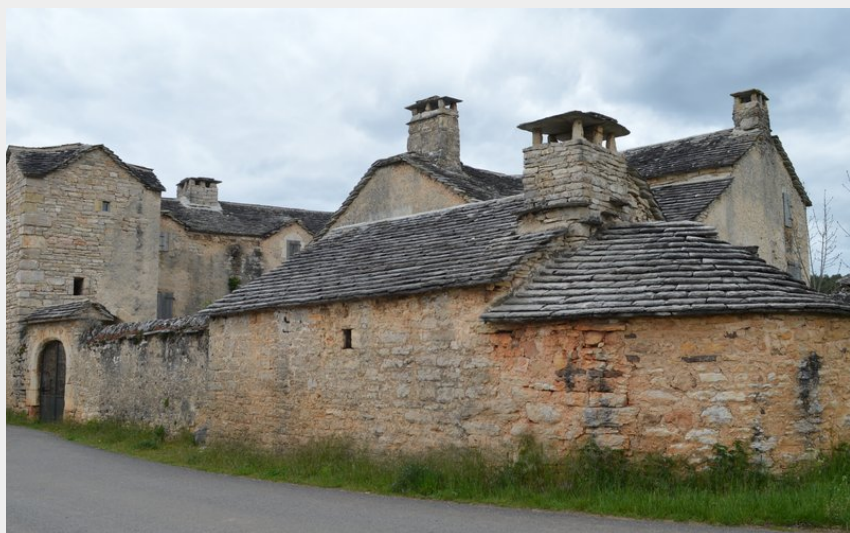
Ferme aux Monziols