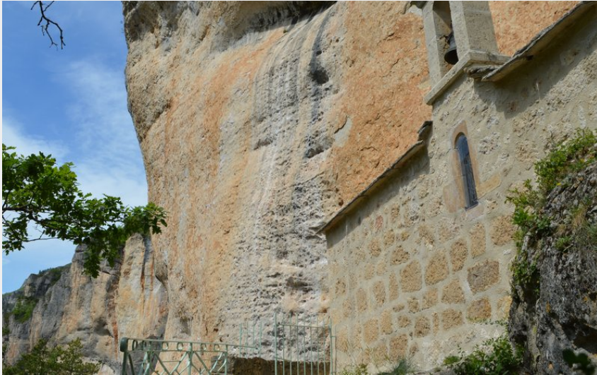
Crédit photo : Chapelle Saint-Hilaire (Roxane Carrat - Conseil départemental Lozère)