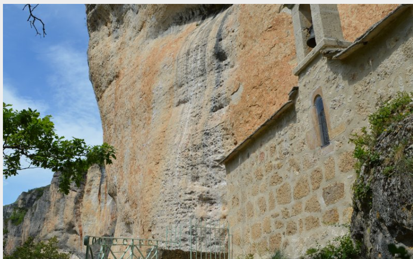
Crédit photo : Chapelle Saint-Hilaire (Roxane Carrat - Conseil départemental Lozère)