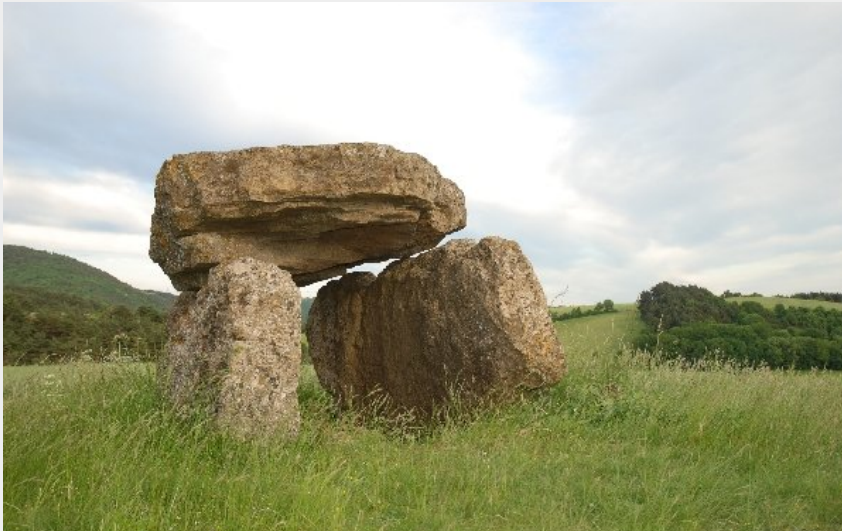
Crédit photo : La Maison des Dolmens (OFFICE DE TOURISME DE SEVERAC LE CHATEAU)