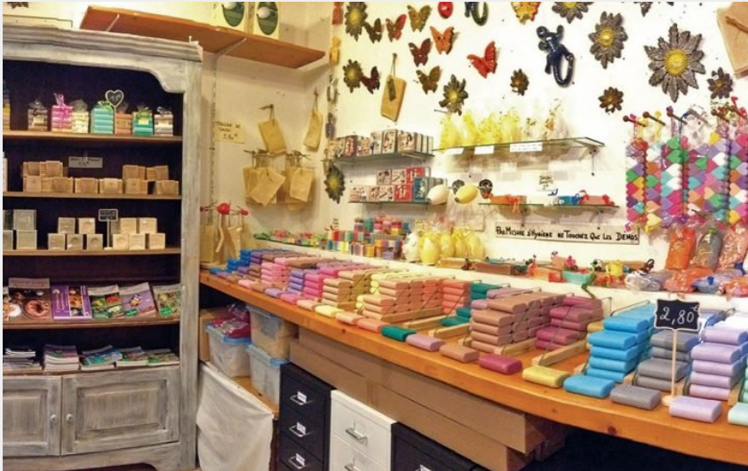
L'Orée du bois et la savonnerie