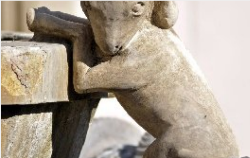
Visite de ville de Saint-Affrique