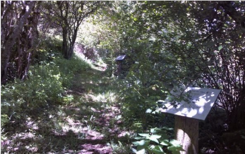
Crédit photo : Sentier botanique (OFFICE DE TOURISME DE PARELOUP LEVEZOU)