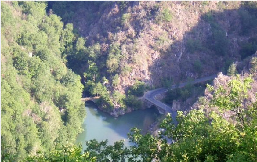
Le Tarn vue du Roc Saint-Jean