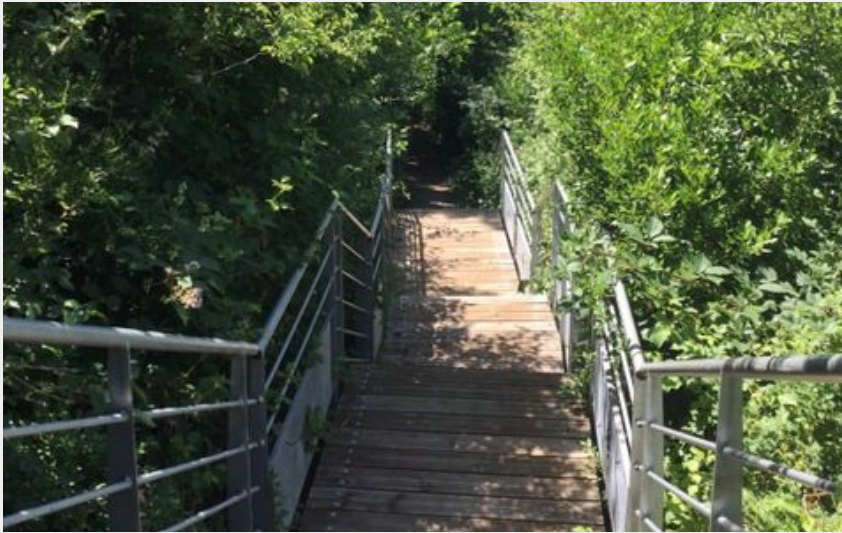
cheminement de micropolis au village