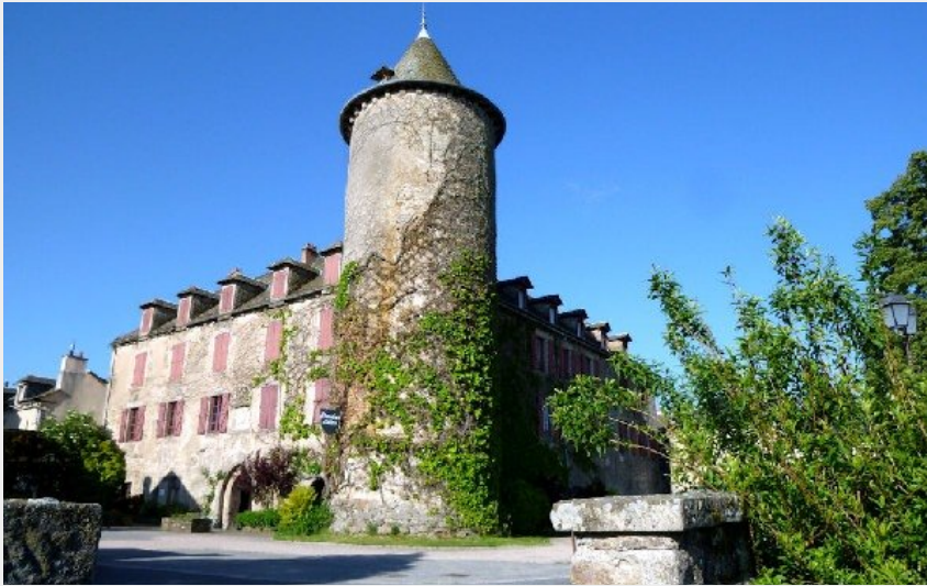
Château des évêques