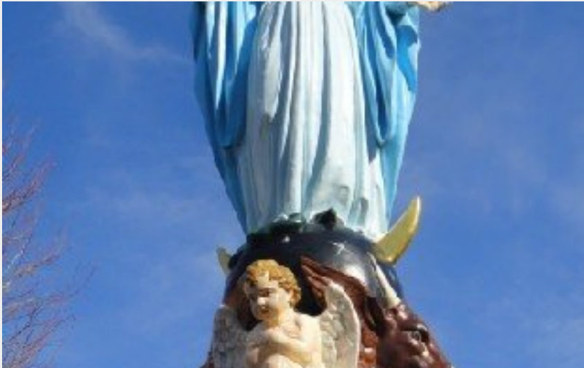
Crédit photo : Statue de la Vierge du Village (OFFICE DE TOURISME DE SALLES CURAN - PARELOUP)