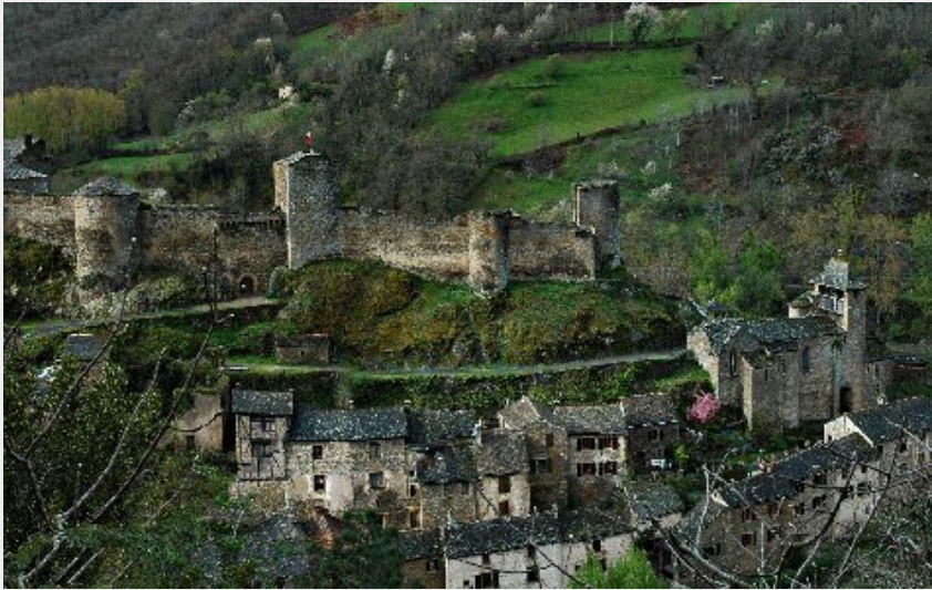
Crédit photo : CHATEAU DE BROUSSE - CÔTÉ NORD (ALAIN DRUILHE CERRÈRE)