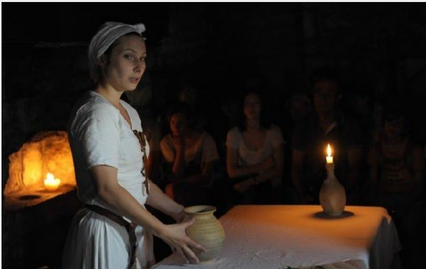
La Maison de Jeanne - L'une des plus anciennes maisons de l'Aveyron