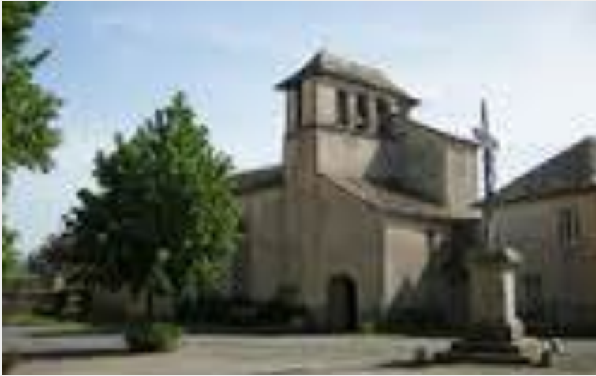
Chapelle Notre-Dame d'Aures