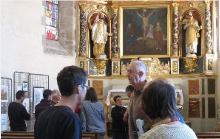
Crédit photo : Eglise Saint-Martin des Faux (Syndicat d'initiative d'Arviou)