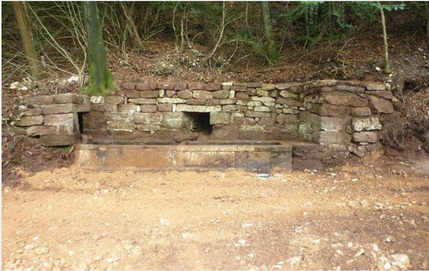
La Fontaine des Barthes