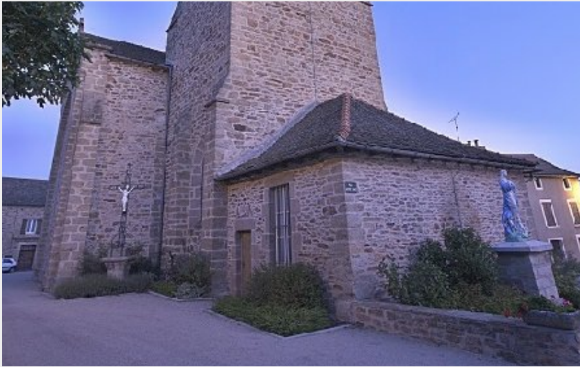
Crédit photo : Eglise Notre Dame (OFFICE DE TOURISME DE PARELOUP LEVEZOU)