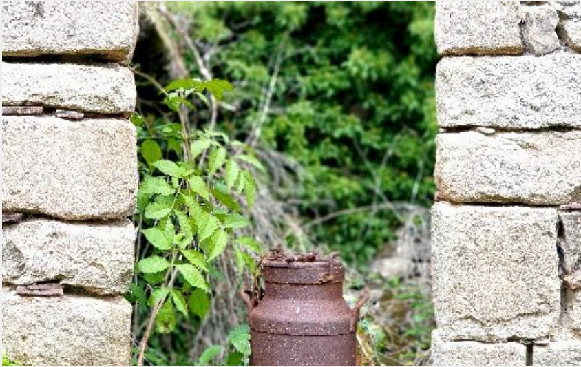
Crédit photo : Hameau médiéval de Saint-Caprazy (ROQUEFORT TOURISME)