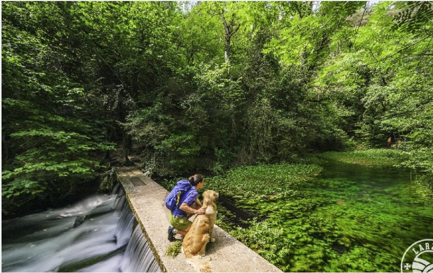
La source du Durzon