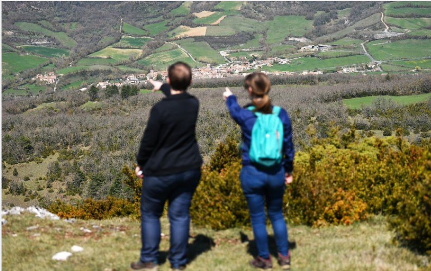
Vue sur Ste-Eulalie de Cernon et la vallée