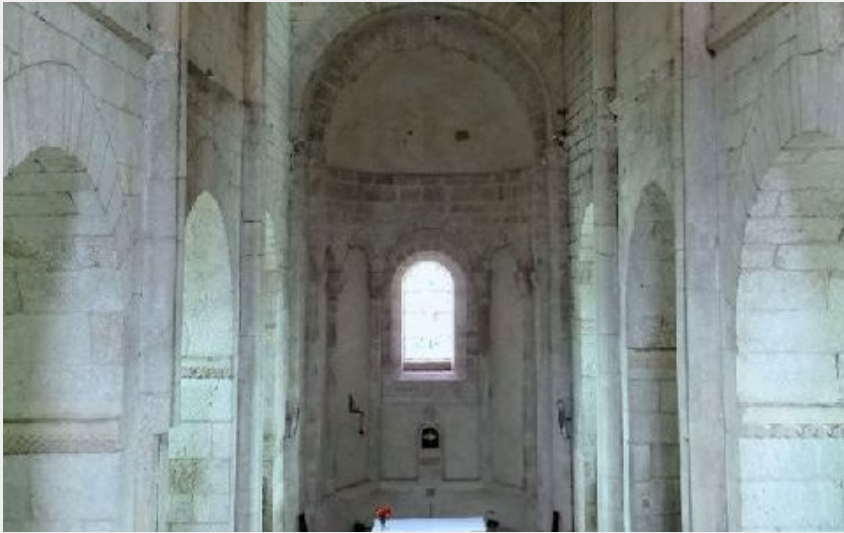
Église St-Michel