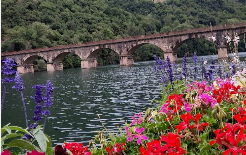
Découvrir le village de Lincou