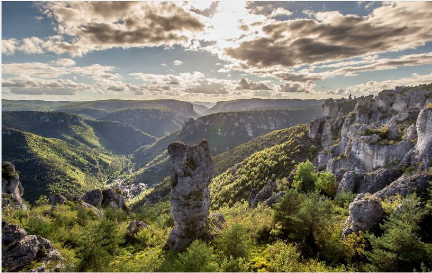
Poupées de roche dans les Gorges de la Dourbie