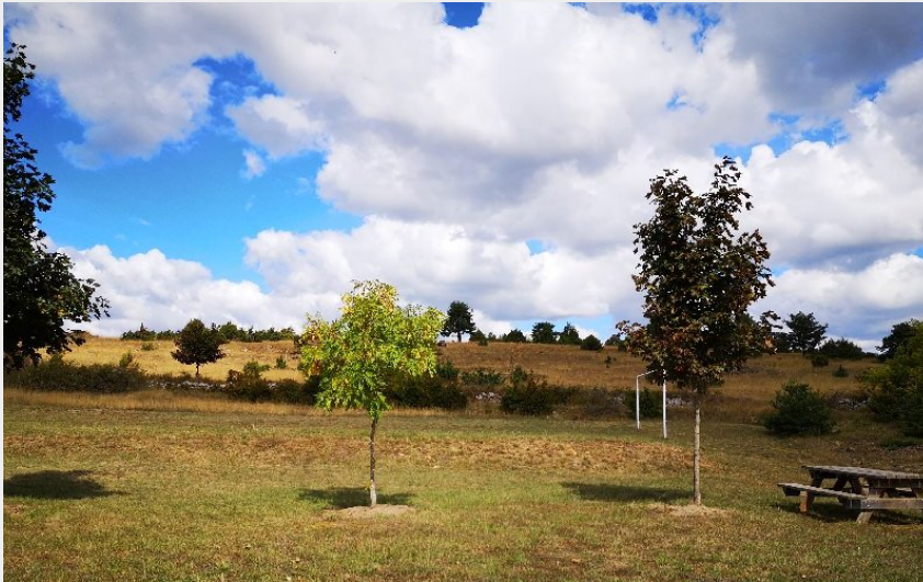
Aire de pique-nique de Saint-André-de-Vézines