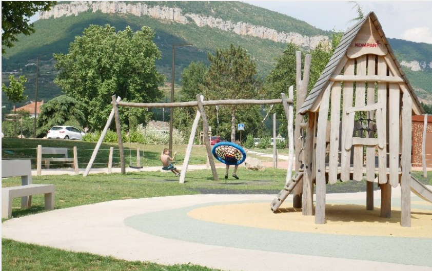
Aire de pique-nique de Gourg de Bades