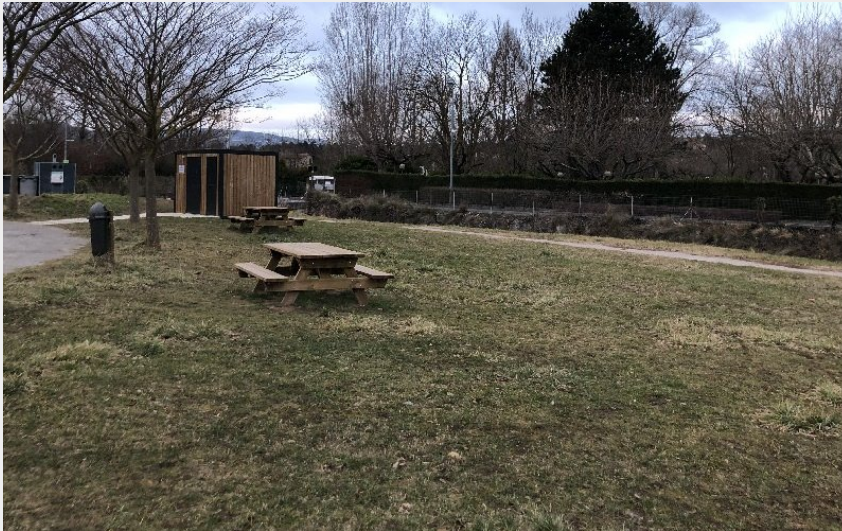
Aire de pique-nique de Saint-Estève