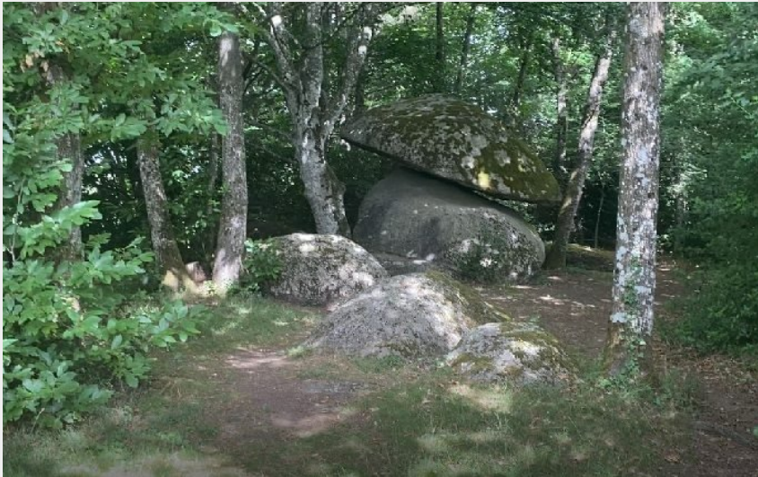
Rocher champignon de Peyrelevade