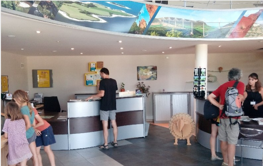
Espace accueil