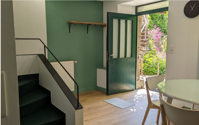
Pièce principale (séjour/cuisine + WC)